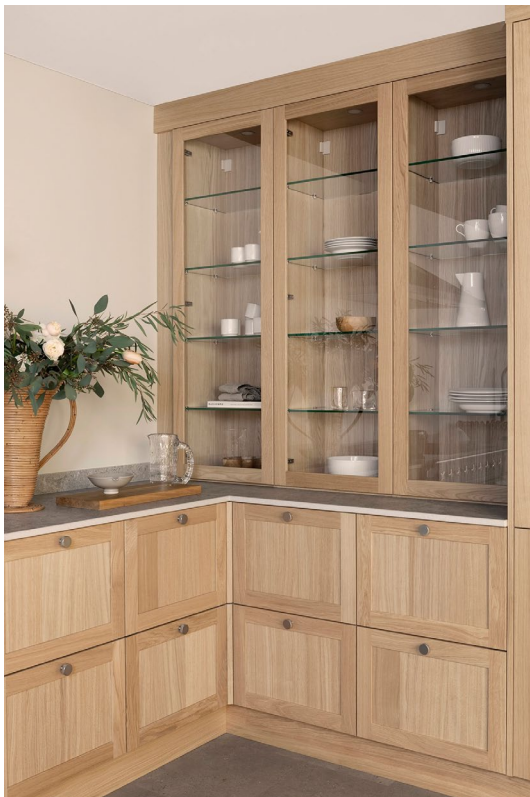
Hver front er unik

Ved malt Vinje: Ask har tydelige porer som kan skinne igjennom når treet males, spesielt med lyse farger.