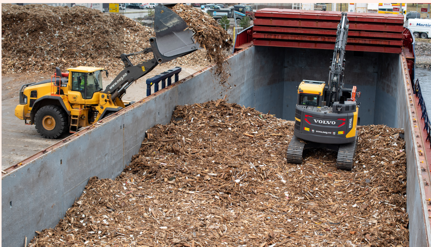
Vige, treavfall lastes på returlast til Europa.

Ved å kombinere resirkulert tre med naturlige materialer som finér og heltre, skaper vi produkter som er både vakre, holdbare og bærekraftige. Vi bruker også 100 % resirkulert og resirkulerbar papp til fraktemballasje.