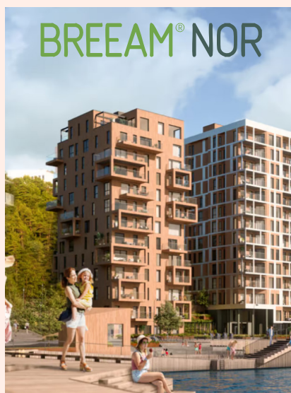
Kanalbyen de tre søstre