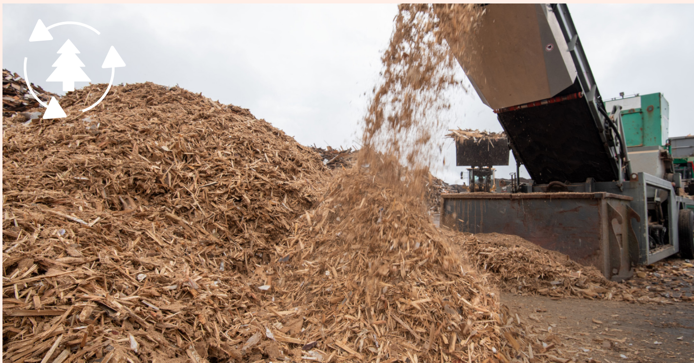
Treavfall på Stølheia avfallstasjon.

Bruk av resirkulert tre reduserer avfallsbelastningen og støtter en mer effektiv ressursutnyttelse. Samtidig bidrar dette til bevaring av skogressurser, som er essensielt for karbonlagring og biologisk mangfold.