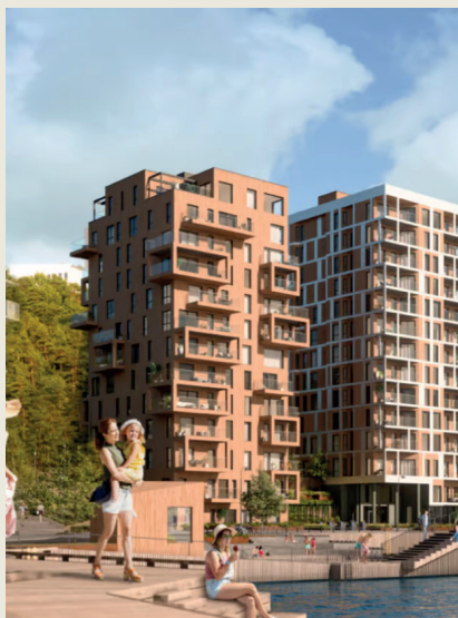
Kanalbyen de tre søstre