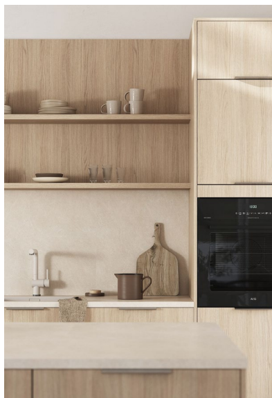
Lys eik dekor