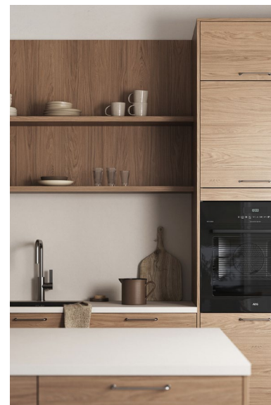
Natur eik dekor