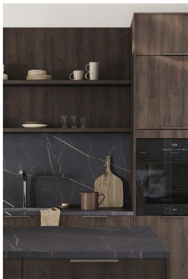
Mørk brun eik dekor