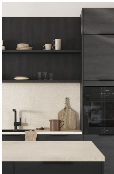
Sort eik dekor