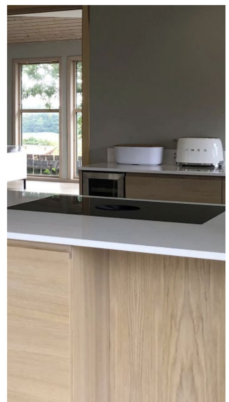
Ulik struktur dekkside og front

Med stolte tradisjoner helt tilbake til 1929, er Strai Kjøkken en heleid norsk familiebedrift. I snart 100 år har vi produsert og levert kvalitetsprodukter til fornøyde kunder i hele Norge.